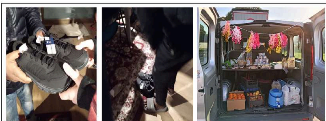
Figura 1. Attività di sostegno alle persone fuori accoglienza svolta dagli attivisti e dalle attiviste della rete DASI unitamente al monitoraggio.

Il presente report, prodotto tra marzo ed aprile 2024, rappresenta il risultato di questo monitoraggio.